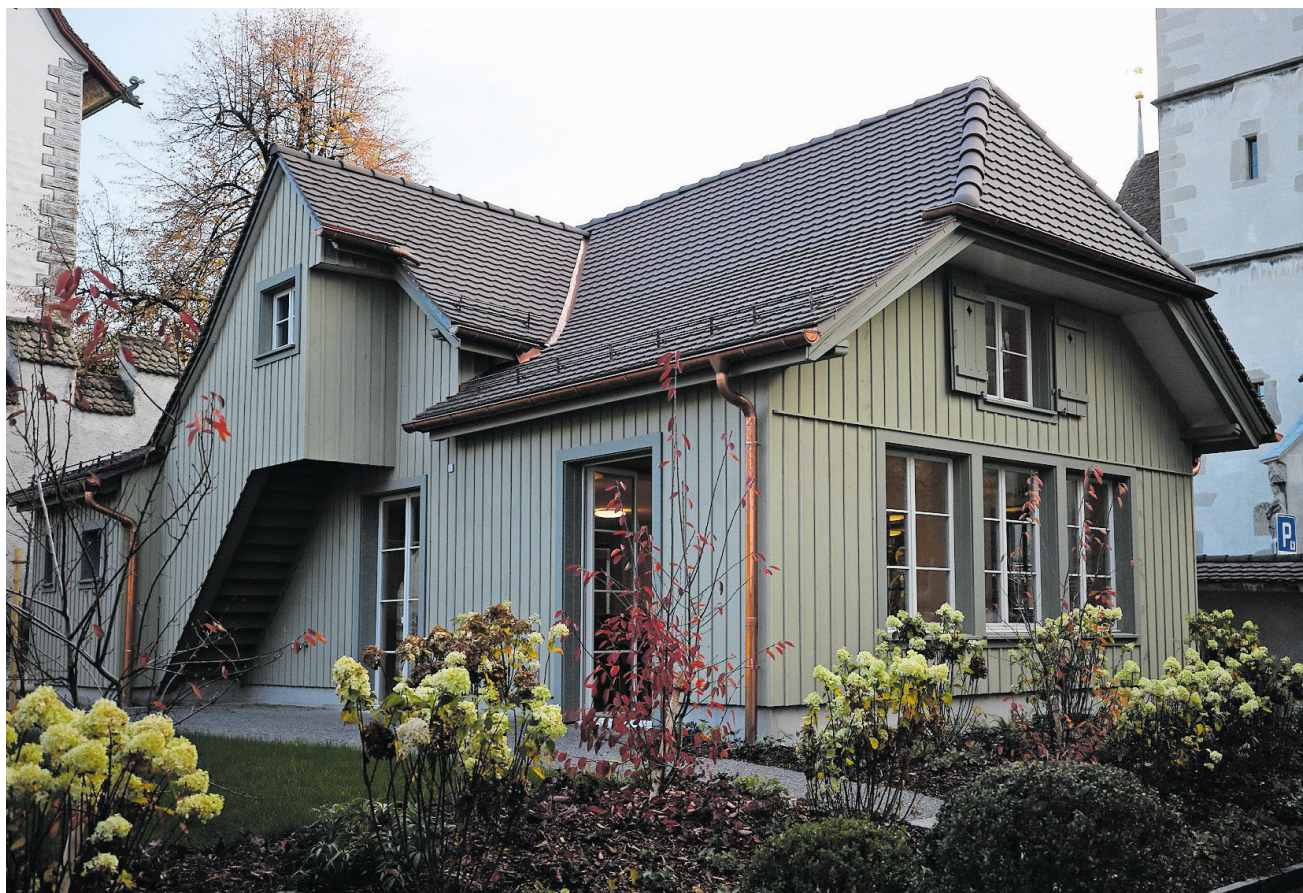
Die historische Bauhütte zwischen der Oswaldskirche und der Burg ist neu renoviert. Im Inneren sind zwei Glasfenster in die Wand eingelassen, die 1866 für die Oswaldskirche angefertigt worden waren (Bild unten). Bilder: Stefan Kaiser (Zug, 7. November 2018)

Während der etwas mehr als fünf Jahre dauernden Renovation der St. Oswaldskirche wurden in der Zuger «Dombauhütte» Tonnen von Sandstein be-